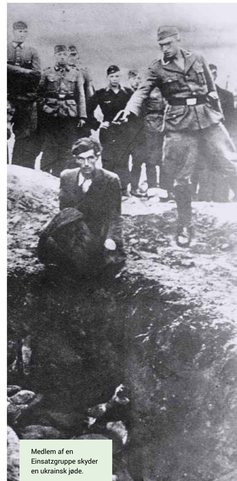
Medlem af en Einsatzgruppe skyder en ukrainsk jøde.

Læs mere om Holocaust på www.folkedrab.dk/holocaust