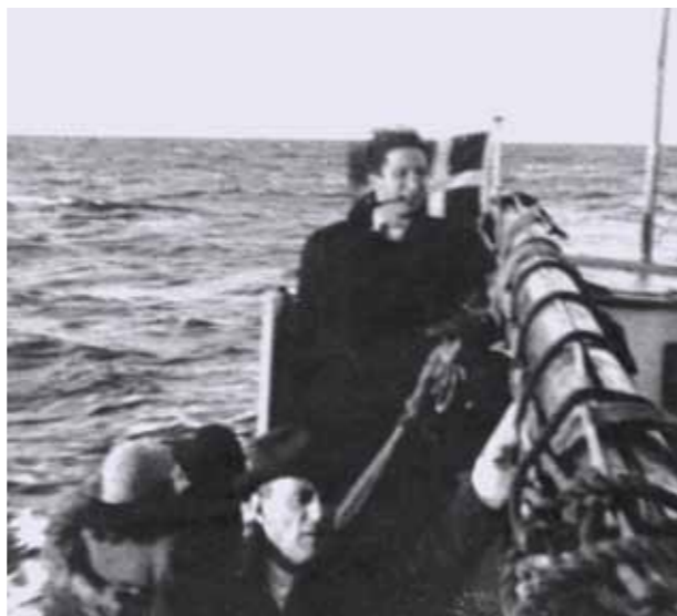
I oktober 1943 hjalp tusindvis af danskere deres jødiske medborgere med at flygte fra nazisternes forfølgelser. Flugten foregik med båd over Øresund.

Den 1. oktober 1943 indledte den tyske besættelsesmagt jagten på de danske jøder. Inden da var planerne om den forestående aktion blev lækket til det jødiske samfund, og langt de fleste jøder forsøgte at flygte fra Danmark til Sverige. Tusindvis af ikke-jødiske danskere blev direkte eller indirekte involveret i deres flugt. Hjælperne kom fra alle samfundslag, på tværs af politisk overbevisning og både med og uden erfaringer