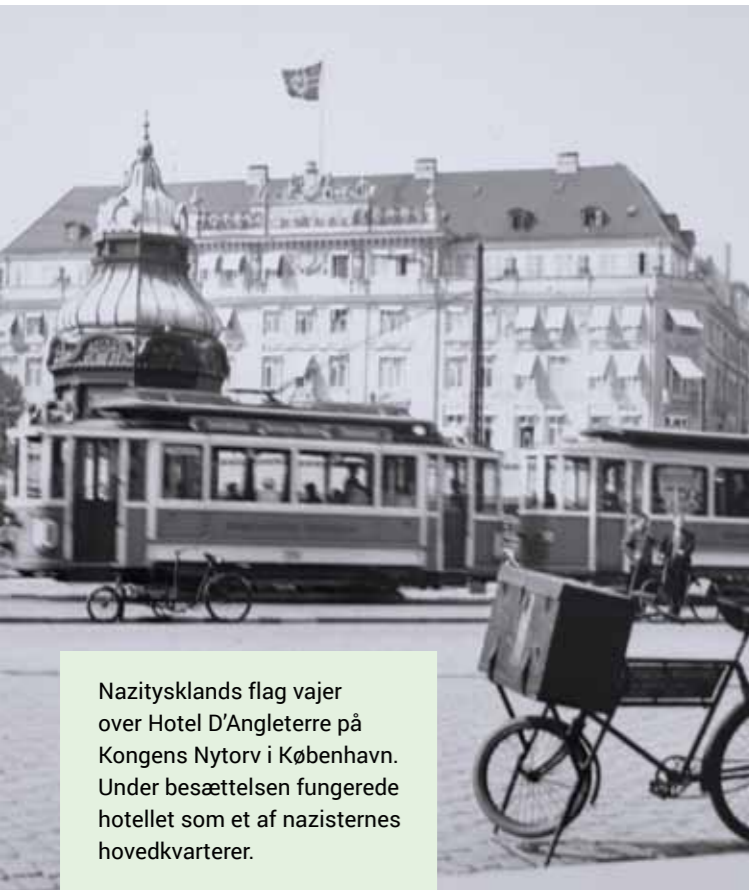
Nazitysklands flag vajer over Hotel D'Angleterre på Kongens Nytorv i København. Under besættelsen fungerede hotellet som et af nazisternes hovedkvarterer.