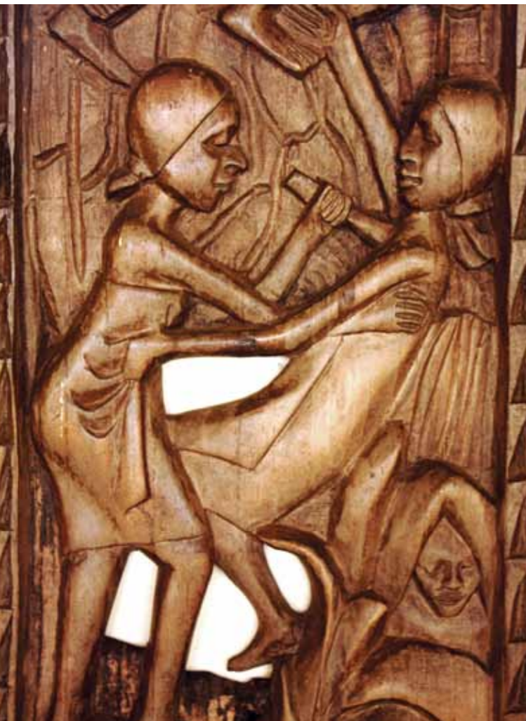
Træudskæring med motiv fra folkedrabet i Rwanda i 1994 lavet af rwandisk kunstner. Opstillet på Murambi Genocide Memorial Centre, Rwanda.

det sat i system (ofte af en stat eller anden autoritet) med det særlige formål helt at fjerne en gruppe mennesker fra samfundet. Folkedrab er det mest ekstreme eksempel på intolerance, men mekanismerne bag er ikke nødvendigvis ekstreme. For folkedrab sker ikke fra den ene dag til den anden. Det er en proces over tid, der ofte starter med tanken om, at nogle mennesker er mindre værd end andre. Har man først stemplet en