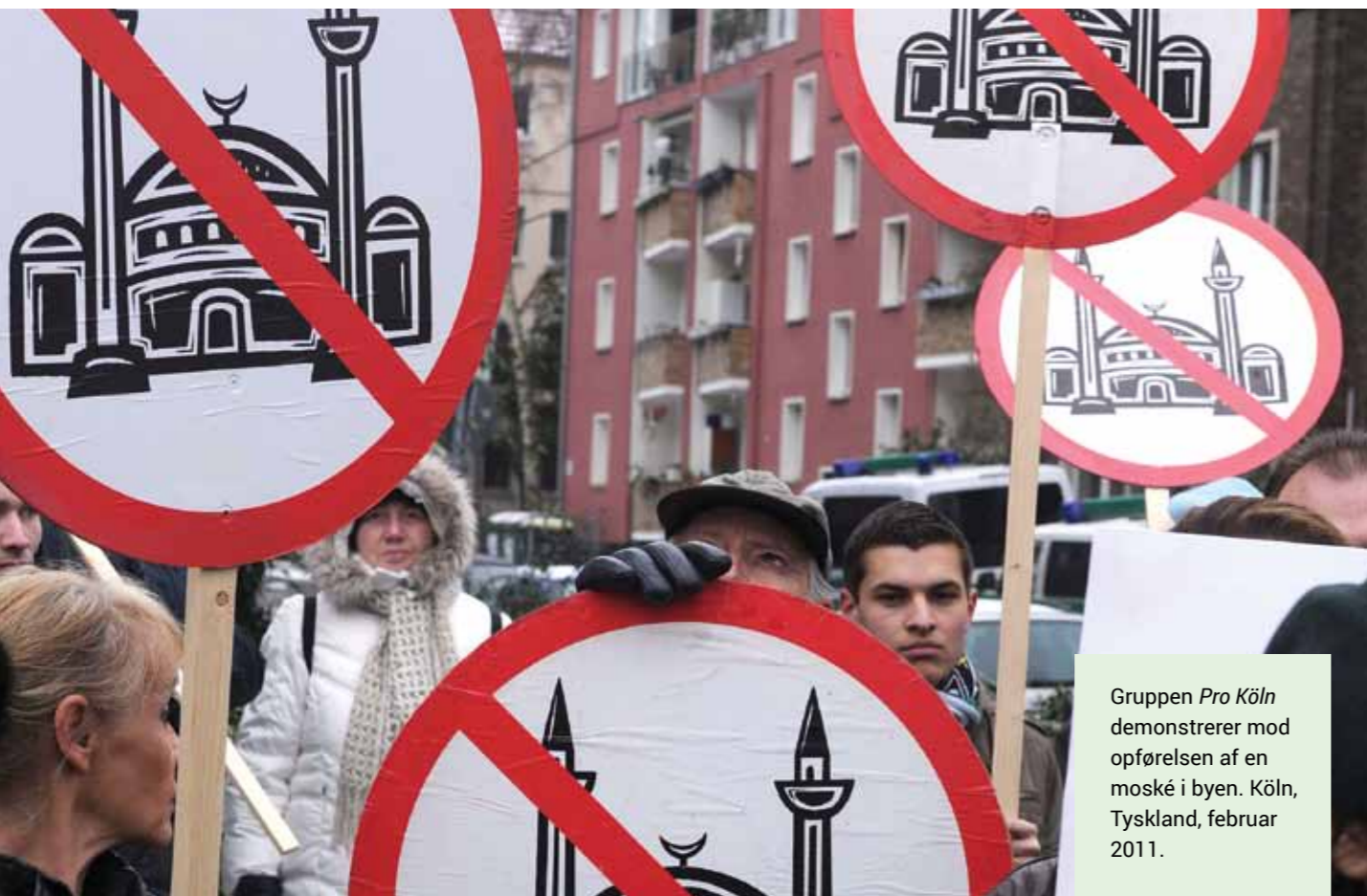
Gruppen Pro Köln demonstrerer mod opførelsen af en moské i byen. Köln, Tyskland, februar 2011.

Jacobsen, Brian Arly: "Islamofobi spøger i dansk islamkritik", Religion.dk , marts 2014. Kan læses på www.religion.dk