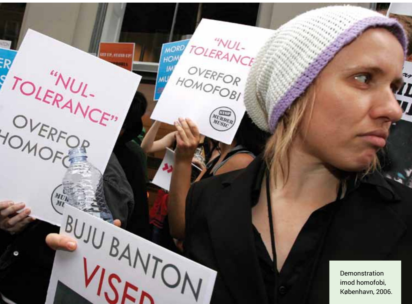
Demonstration imod homofobi, København, 2006.