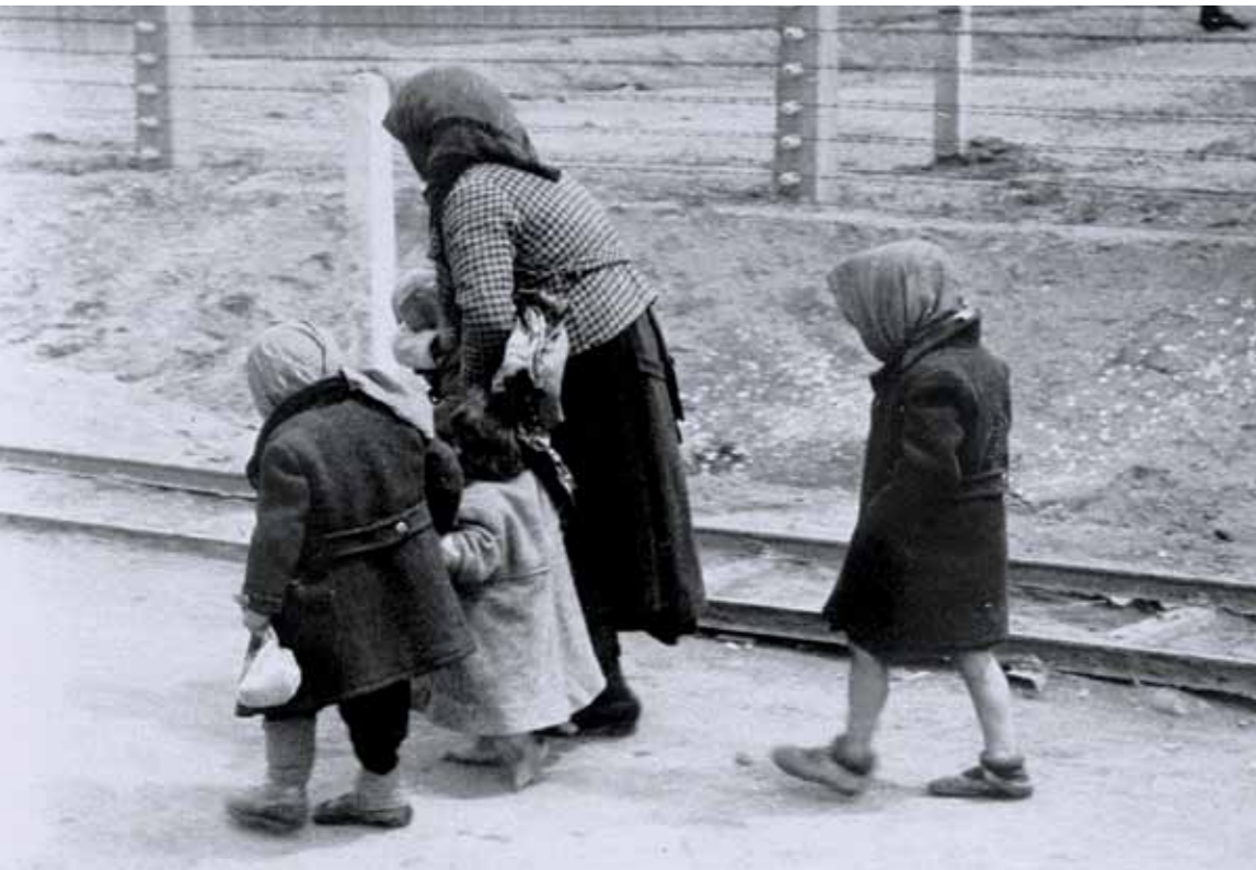
Jødisk kvinde og tre børn går mod gaskammeret i kz- og udryddelseslejren Auschwitz-Birkenau.