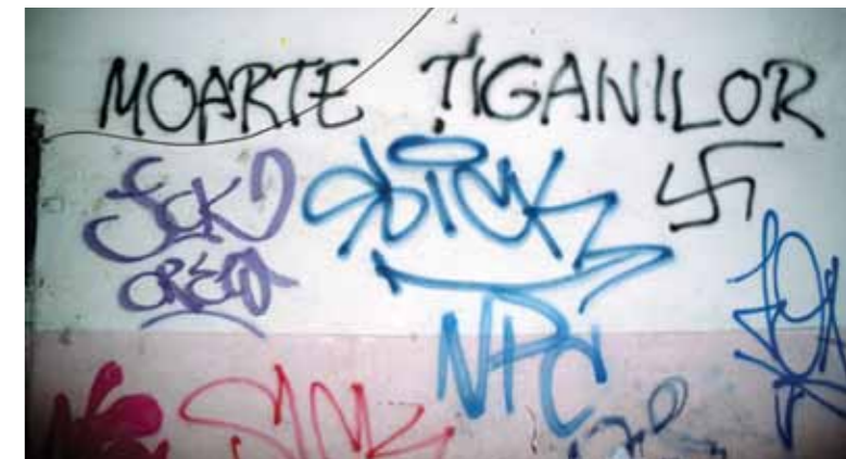
Teksten "Dræb sigøjnerne" og et hagekors malet på en mur i Rumæniens hovedstad, Bukarest.

"en bestående latent struktur af forestillinger fjendtlige mod romaer som kollektiv, som på det individuelle plan manifesterer sig som attituder, og i kulturen som myter, ideologi, folkelige traditioner og billedsprog, og i handlinger som social eller legal diskriminering,