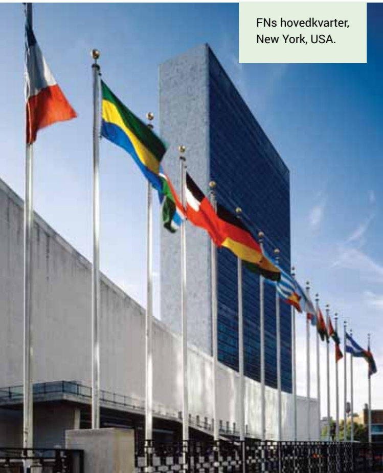
FNs hovedkvarter, New York, USA.