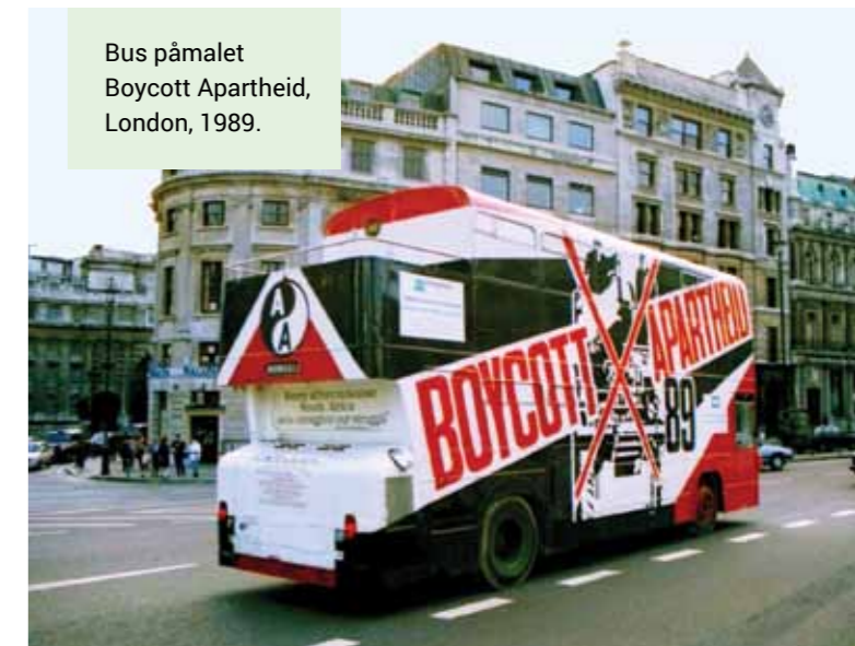
Bus påmalet Boycott Apartheid, London, 1989.

Den sorte befolknings politiske rettigheder blev begrænset til kun at gælde inden for de reservater, hvor de levede. Og her var der kun valgret til en del af selvstyreorganerne. De sortes borgerretsorganisationer blev forbudt, og deres politiske ledere blev fængslet eller måtte gå i landflygtighed. Apartheidregimets mest kendte politiske fange er Nelson Mandela (1918-2013), lederen af Sydafrikas største befrielses-