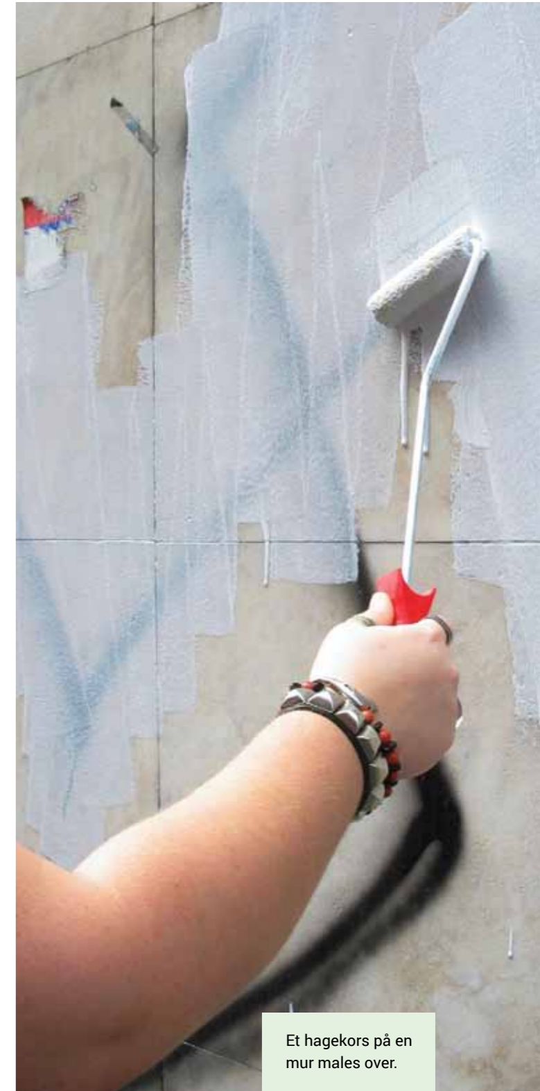
Et hagekors på en mur males over.

Det skal ved straffens fastsættelse i almindelighed indgå som skærpende omstændighed, at gerningen har baggrund i andres etniske oprindelse, tro, seksuelle orientering eller lignende.