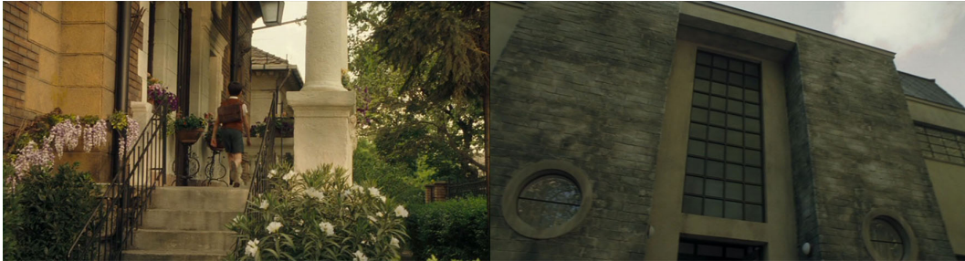
Brunos gamle hus i byen til venstre og det nye hus tæt på lejren til højre

Drengen i den stribeede pyjamas forgår på få locations. Filmen starter i familiens flotte gamle hus, hvorefter de flytter ud til det mere moderne hus på landet, der ligger tæt på kz-lejren. Huset, som familien flytter ind i, virker ikke særligt indbydende. Da familien ankommer, siger tjenestepigen til Bruno, at de selv må gøre noget for at gøre huset til deres eget. Moderen er chokeret over, at de bor så tæt på lejren, som Bruno først tror, er en bondegård, men som han senere forstår, er en kz-/udryddelseslejr. Mødet mellem livet i hjemmet og i lejren er meget centralt i filmen.