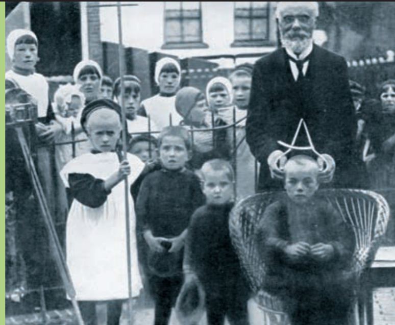
En videnskabsmand måler børns hoveder på øen Urk i Holland (1910).