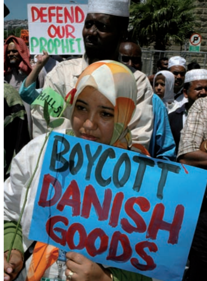
Muslimer demonstrerer imod de danske tegninger af profeten Muhammed.