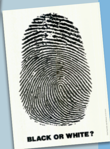
"Sort eller hvid?" (Anti-Racism Information Center, Holland)