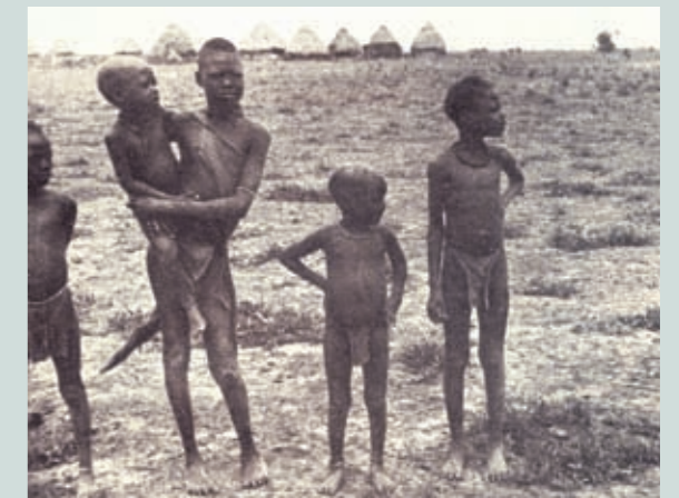
Billede fra geografibog (1937).

B. Læs afsnittet "Racisme – også i dag". Hvorfor inddeler man ikke længere verdens befolkning i racer?