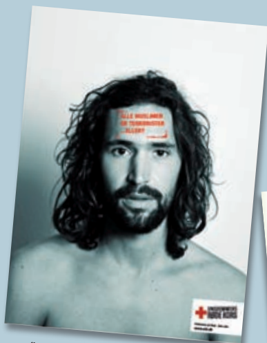
"Alle muslimer er terrorister...eller?" (Ungdommens Røde Kors, Danmark)