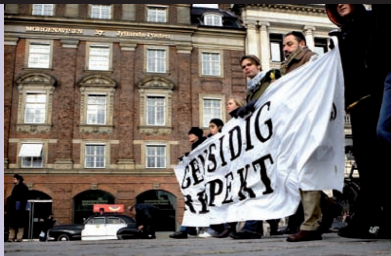
Demonstration for gensidig respekt foran Jyllands-Postens bygning i København. Både muslimer og ikke-muslimer demonstrerer.