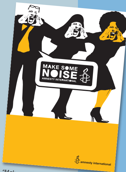
"Make some noise." (Amnesty International Danmark)